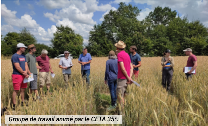
Groupe de travail animé par le CETA 35*.

Afin d'agir sur la qualité de l'eau et des milieux aquatiques, Eaux & Vilaine a mis en place un plan d'actions destiné à l'ensemble des acteurs du territoire et suit périodiquement la qualité de l'eau afin d'évaluer l'efficacité des mesures.