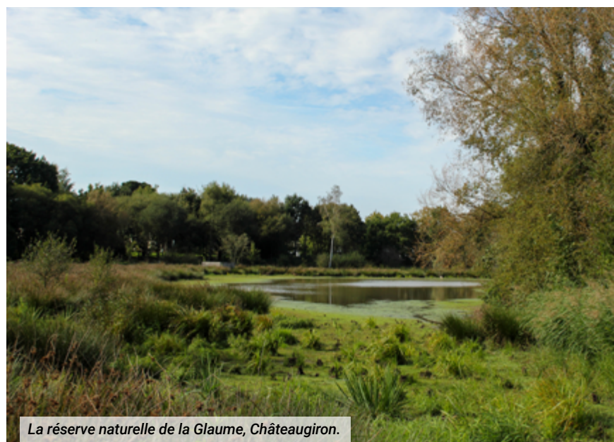
La réserve naturelle de la Glaume, Châteaugiron.

Eaux & Vilaine travaille à l'échelle des bassins versants. Ses actions sont toutes fléchées pour atteindre « le bon état chimique, biologique et physique des rivières, des lacs, des eaux souterraines et du littoral ainsi que le bon fonctionnement écologique des milieux aquatiques associés » conformément aux objectifs fixés par la Directive Cadre Européenne 2000 et à la loi Grenelle de l'Environnement de 2009. À l'échelle locale, cette planification s'intègre dans le Schéma d'Aménagement et de Gestion des Eaux (SAGE) de la Vilaine.