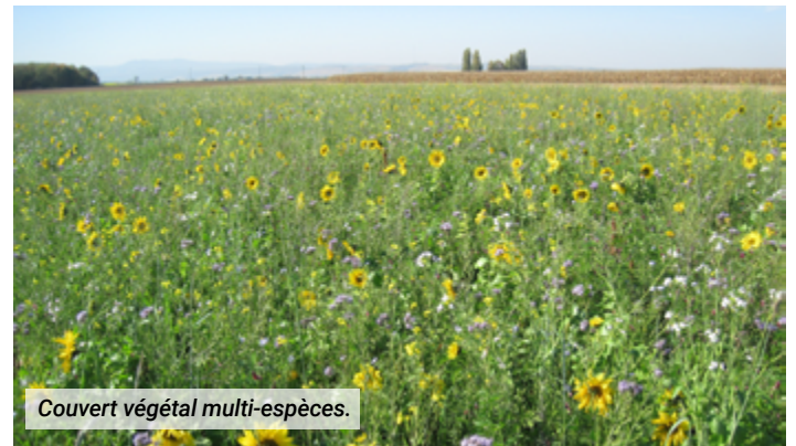
Couvert végétal multi-espèces.

Enfin, la restauration des zones humides et des rivières sont des volets également essentiels du plan d'action d'Eaux & Vilaine pour améliorer la résilience des milieux. L'ensemble de ces actions agit tant sur la qualité que la quantité d'eau à disposition sur le territoire.