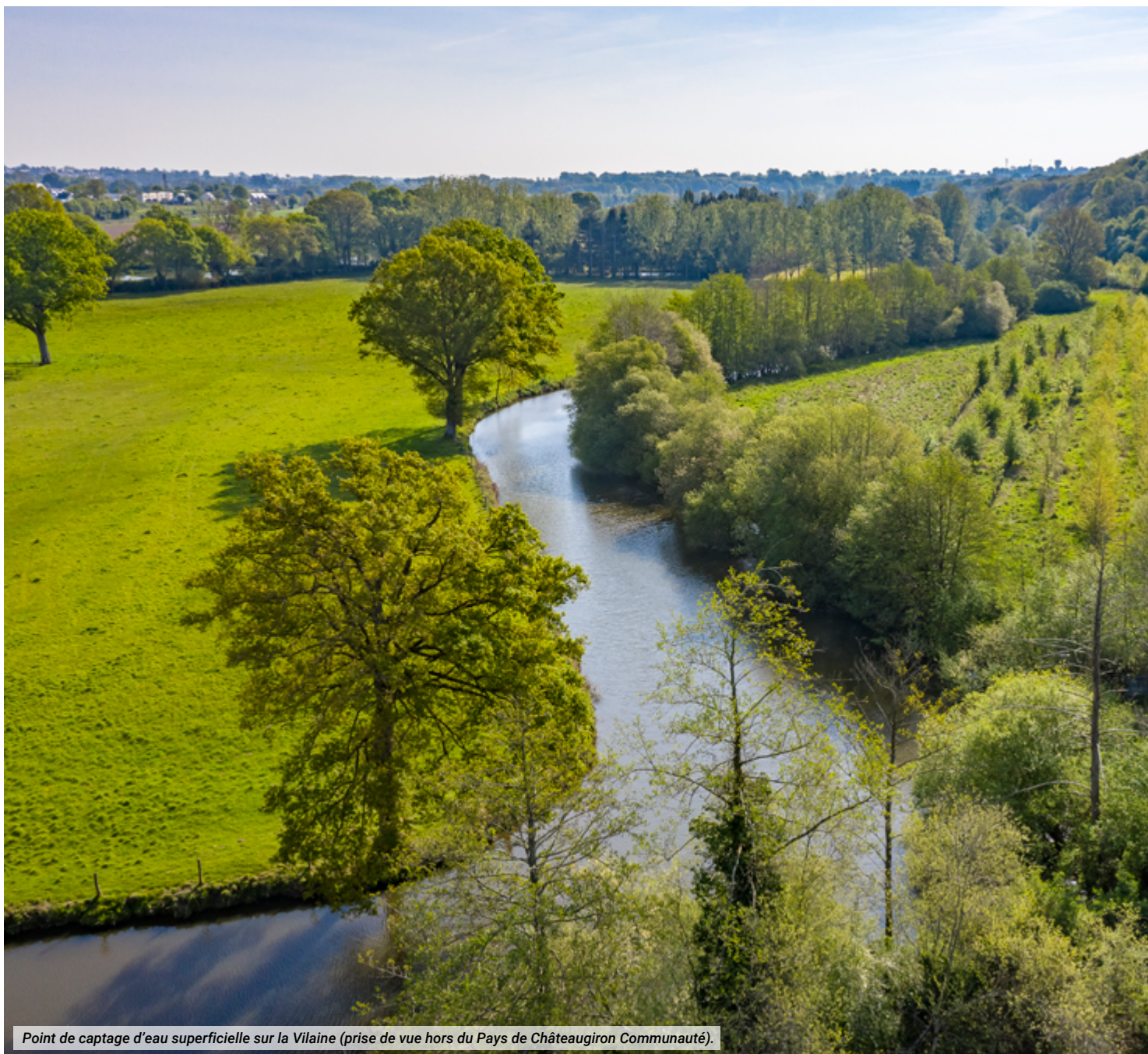
Point de captage d'eau superficielle sur la Vilaine (prise de vue hors du Pays de Châteaugiron Communauté).