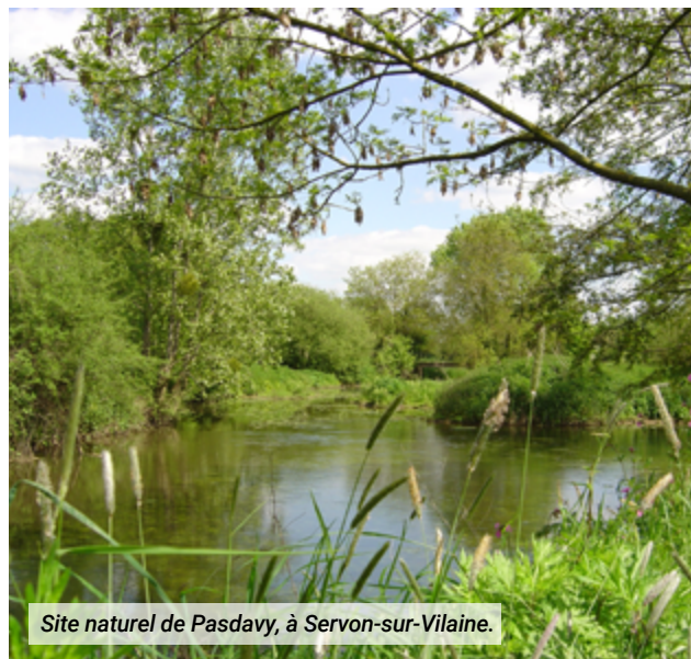
Site naturel de Pasdavy, à Servon-sur-Vilaine.

À l'échelle de notre territoire, le document de référence est le SAGE, Schéma d'Aménagement et de Gestion des Eaux de la Vilaine, qui fixe pour 6 ans un projet d'actions pour atteindre le « bon état chimique et écologique des masses d'eau ». Le SAGE est élaboré par la CLE, Commission Locale de l'Eau d'Eaux & Vilaine; la CLE étant composée d'acteurs locaux.