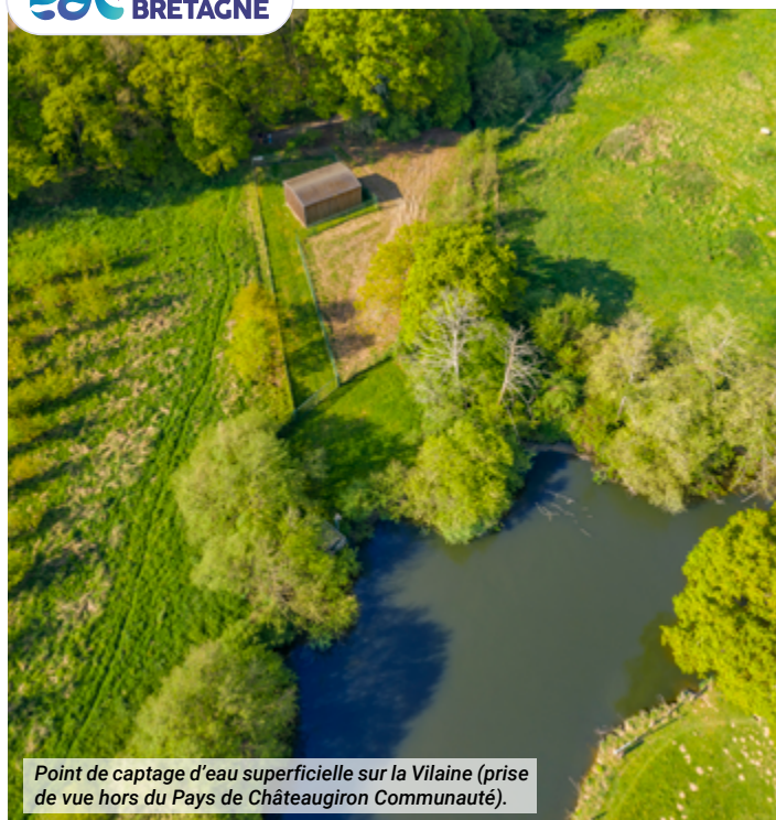
Point de captage d'eau superficielle sur la Vilaine (prise de vue hors du Pays de Châteaugiron Communauté).