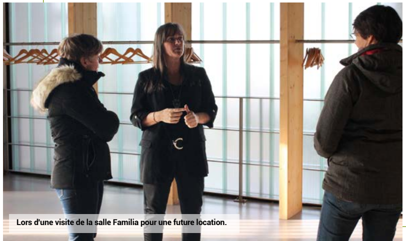
Lors d'une visite de la salle Familia pour une future location.

Implantée à Servon-sur-Vilaine, Familia dispose de 2 salles indépendantes, l'une pouvant accueillir 75 personnes, l'autre 190 personnes. Tréma, située à Noyal-sur-Vilaine dispose d'une capacité d'accueil de 400 personnes.