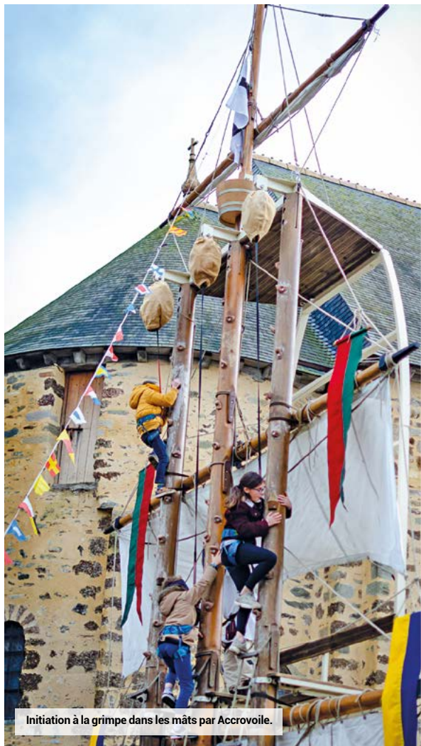
Initiation à la grimpe dans les mâts par Accrovoile.

Le Festival du Livre médiéval et de l'imaginaire est devenu un événement phare du territoire depuis 2007. Avec plus de 9 000 personnes (visiteurs, rencontres avec les auteurs, spectacles et animations, marché, expositions, contes, rencontres scolaires, visites en entreprises...), l'édition des 23 et 24 novembre 2019 a confirmé l'ancre fort de cette manifestation culturelle unique et originale sur le territoire du Pays de Châteaugiron Communauté.