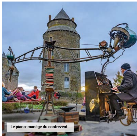
Le piano-manège du contrevent.