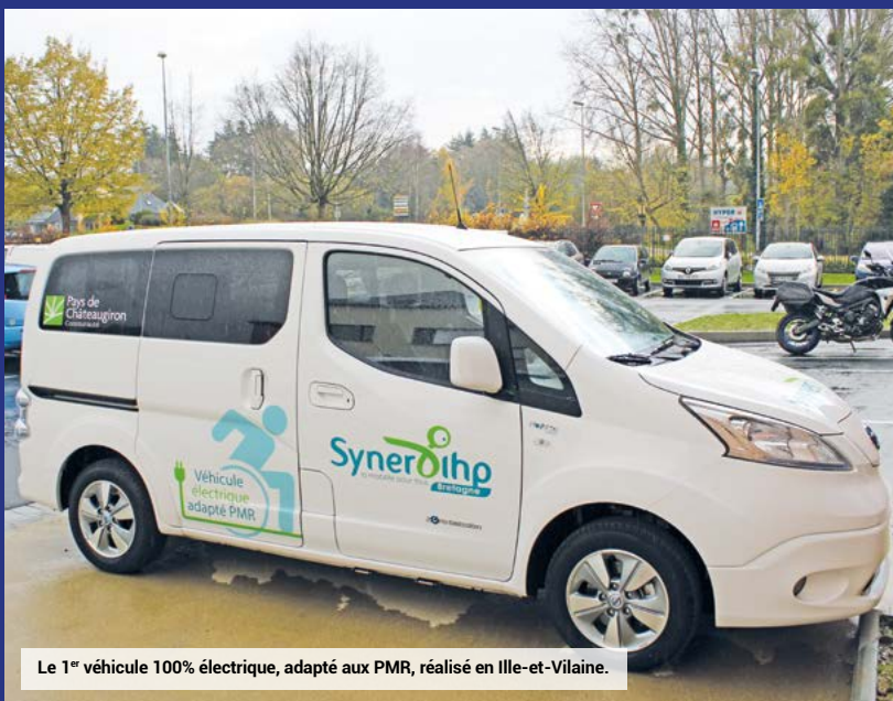
Le 1 er véhicule 100% électrique, adapté aux PMR, réalisé en Ile-et-Vilaine.

ARRIVÉE : 1 des 5 communes du territoire, Rennes, Vern-sur-Seiche, Chantepie, Cesson-Sévigné, Acigné, Brécé, Betton, Saint-Grégoire et Janzé.