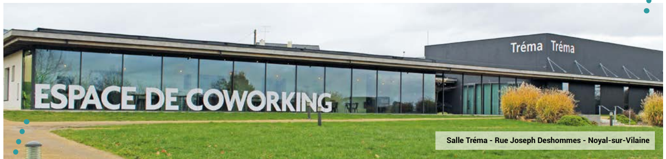
Salle Tréma - Rue Joseph Deshommès - Noyal-sur-Vilaine

Accès : à partir du centre-ville de Noyal-sur-Vilaine, rejoignez Tréma en 5 minutes à vélo, 16 minutes à pied et 3 minutes en voiture.