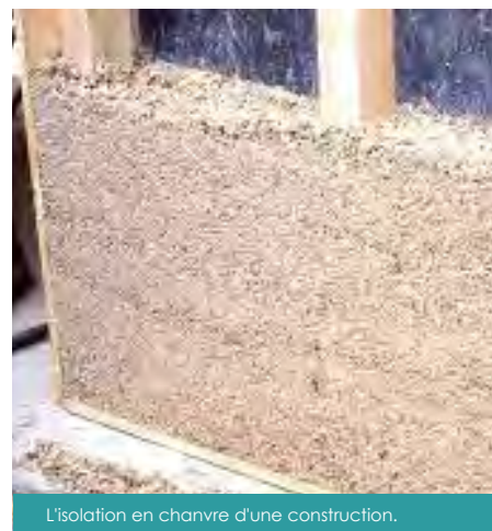
L'isolation en chanvre d'une construction.

evenementiel@espaceecochanvre.com , facebook.com/eco.chanvre ,