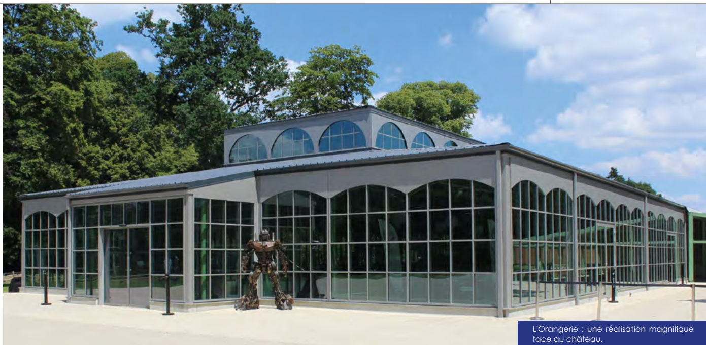
L'Orangerie : une réalisation magnifique face au château.

Contact : 02 23 08 40 80 secretariat@chateaudesperes.fr