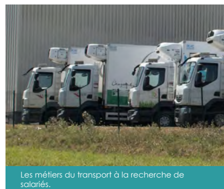
Les métiers du transport à la recherche de salariés.

Antenne de Noyal-sur-Vilaine : 02 99 37 58 76 pae.noyal@pcc.bzh