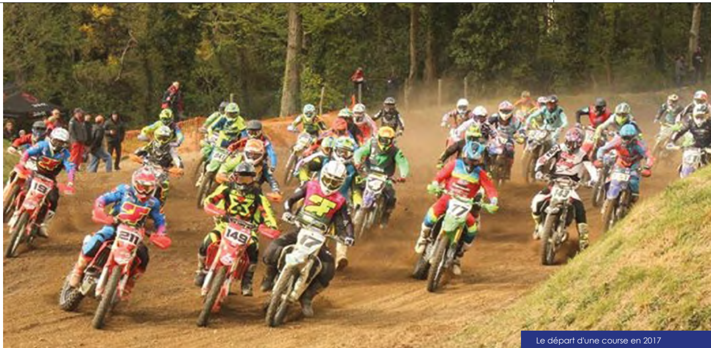
Le départ d'une course en 2017

Circuit de l'Homelais à Ossé De 13h à minuit Entrée : 10 €, gratuit (-14 ans) Restauration et parking sur site. Contact : mclhomelais@gmail.com