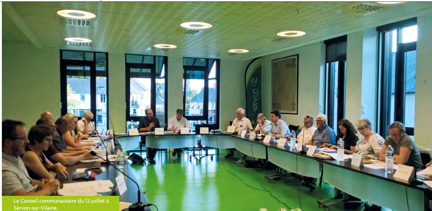
Le Conseil communautaire du 12 juillet à Servon-sur-Vilaine.