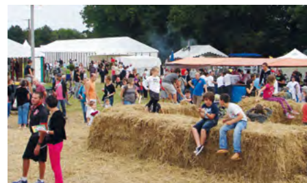
Les Terriales attirent toujours beaucoup de monde.

La journée du dimanche débutera, à 10 heures, par une messe en plein air, sur le site, pour renouer avec la tradition locale, avant un autre temps fort très convivial, le repas autour du boeuf grillé. De nombreuses animations pédagogiques et ludiques seront proposées l'après-midi par les associations et le monde agricole. Un programme convivial placé sous le signe des échanges et de la détente. Une excellente idée de sortie en famille !