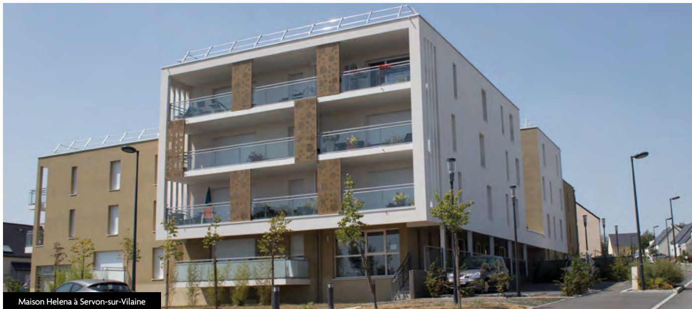
Maison Helena à Servon-sur-Vilaine